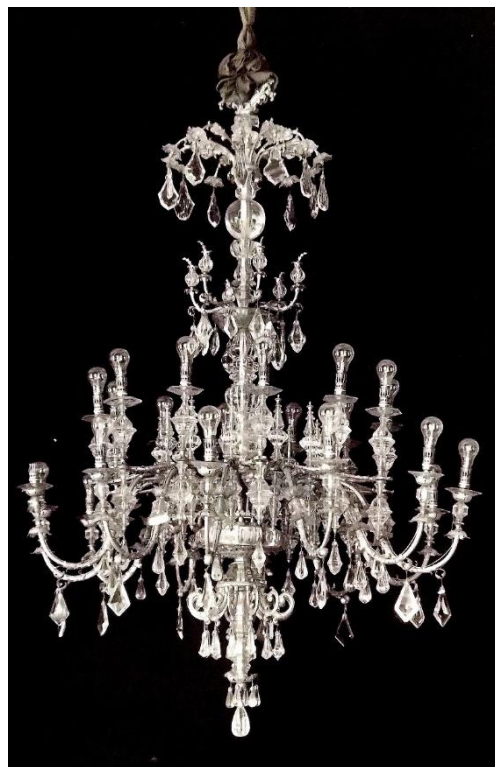
Metelino-Luster im Zimmer Kaiser Franz Josef in der Hofburg, 1983 elektrifiziert von Lobmeyr

Der Künstler wird selbst anwesend sein und über sein Schaffen erzählen.