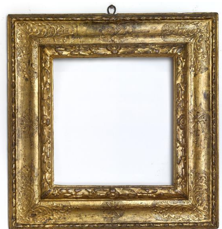
Piemont, Frühbarock, 17. Jahrhundert