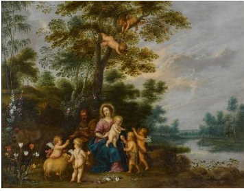
Jan Brueghel der Jüngere