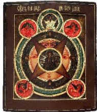
Ikone: „Das allessehende Auge Gottes“, Russland, 19. Jahrhundert