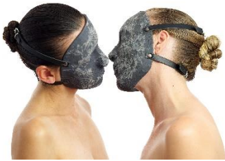
Evelyn Loschy "Friction", 2021