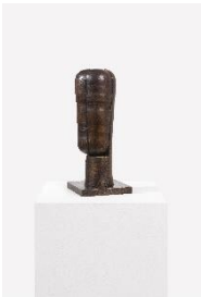
Joannis Avramidis „Kopf II“, 1966

Bild: Galerie bei der Albertina ▪ Zetter