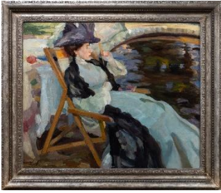
Leo Putz „Dame im Liegestuhl“, um 1906