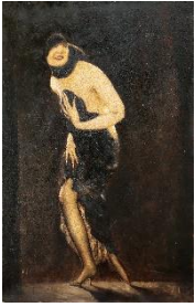
Alfons Walde „Verführung“, 1923

Bild: Kunsthandel Widder, © Bildrecht, Wien 2025