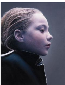
Gottfried Helnwein „Kind 22“, 2025