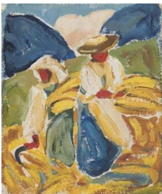
Artur Nikodem „Heuernte“