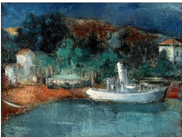
Josef Floch „Das weiße Schiff (Kleiner Dampfer)“, 1927-28