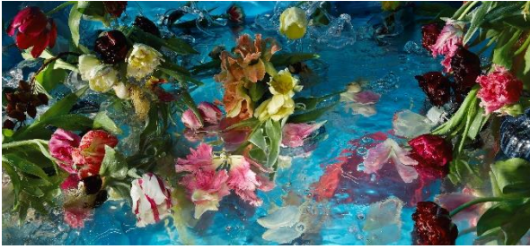
Margriet Smulders „A Saturday in May“, 2019