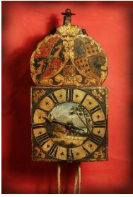
Renaissance Eisenuhr, in der Zeit um 1660

Bild: Walter Moskat Kunst & Antiquitäten