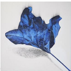
Manfred Bockelmann Ohne Titel, Serie „Sterben der Blätter“, 2024