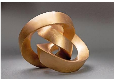
Maximilian Verhas "Small Rolling Spiral", 2025