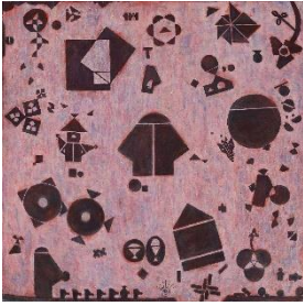
Hildegard Joos „Narrative Geometrismen Nr. 102“, 1985