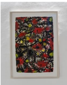
Gunter Damisch Ohne Titel, 1998