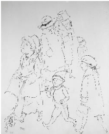
George Grosz „Berliner Straßenszene“