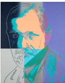
Andy Warhol „Sigmund Freud“, 1980