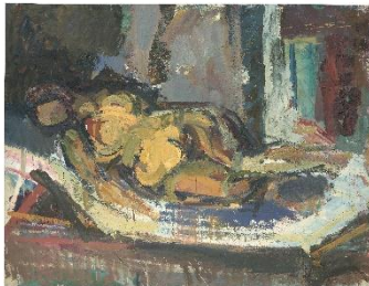
Franz Grabmayr „Liegender Akt“, 1962-64 (Akademiezeit)

Bild: Galerie Artecont, © Grabmayr Estate / Bildrecht, Wien 2025