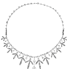
Diamant-Collier Wolfers – Brüssel, ca. 1900