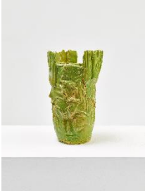
Mai-Thu Perret "To destroy is within me. To put together is also within me", 2022